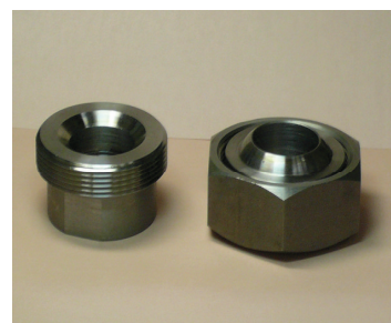
写真-4 コニカルユニオン