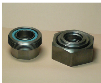
写真-3 インローユニオン